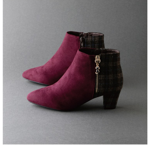
足首で踊るネコのチャームと 今年らしいチェックの切り返しにキュン!

◆ホワイトクローバー／センターモール2F アミュレットペンダント 各¥24,750(税込)