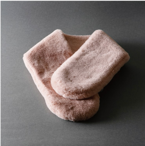
色味もきれいなももこのスヌードで 首元のおしゃれをワンランクUP