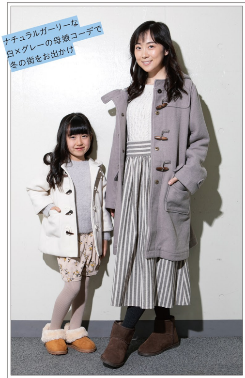
ナチュラルガーリーな 白×グレーの母娘コーデで 冬の街をお出かけ

◆ SM2 keittio / センターモール 2F mother: ダッフルコート ¥17,589(税込) ニット ¥6,589(税込) スカート ¥7,689(税込) タイツ ¥3,289(税込) ムートン風ブーツ ¥6,589(税込) kids: ダッフルコート ¥7,689(税込) ニット ¥3,839(税込) 花柄かぼちゃパンツ ¥3,069(税込) タイツ ¥2,189(税込) ムートン風ブーツ ¥4,939(税込)