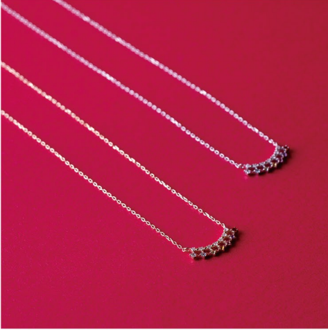
7色の天然石がデコルテにきらめく 「お守りネックレス」

◆ホワイトクローバー／センターモール2F アミュレットペンダント 各¥24,750(税込)