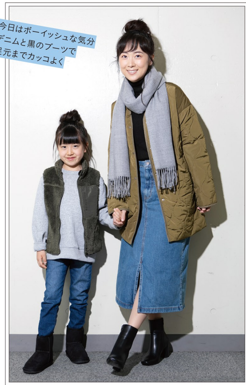
今日はボーイッシュな気分 デニムと黒のブーツで 足元までカッコよく

◆ SM2 keittio / センターモール 2F mother: ダッフルコート ¥17,589(税込) ニット ¥6,589(税込) スカート ¥7,689(税込) タイツ ¥3,289(税込) ムートン風ブーツ ¥6,589(税込) kids: ダッフルコート ¥7,689(税込) ニット ¥3,839(税込) 花柄かぼちゃパンツ ¥3,069(税込) タイツ ¥2,189(税込) ムートン風ブーツ ¥4,939(税込)