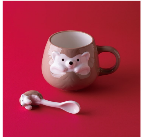
心もおなかもほっこり温めてくれる キュートなハリネズミのマグ&スプーン

◆ブルーブルーエ／センターモール2F マグカップ¥1,320(税込) スプーン¥638(税込)